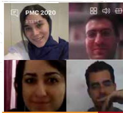
تیم دانشگاه شهید بهشتی ۱