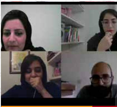
تیم دانشگاه شهید بهشتی ۲