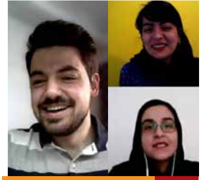
تیم دانشگاه تربیت مدرس ۱