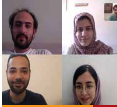
تیم دانشگاه هنر ۲