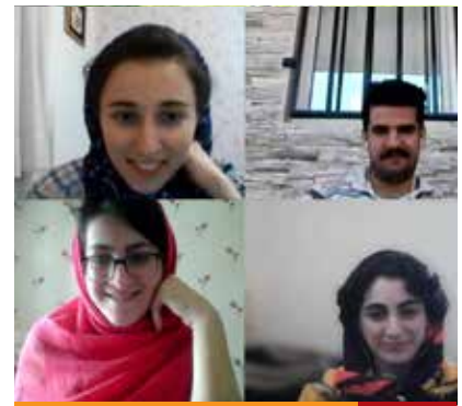
تیم دانشگاه تربیت مدرس ۲